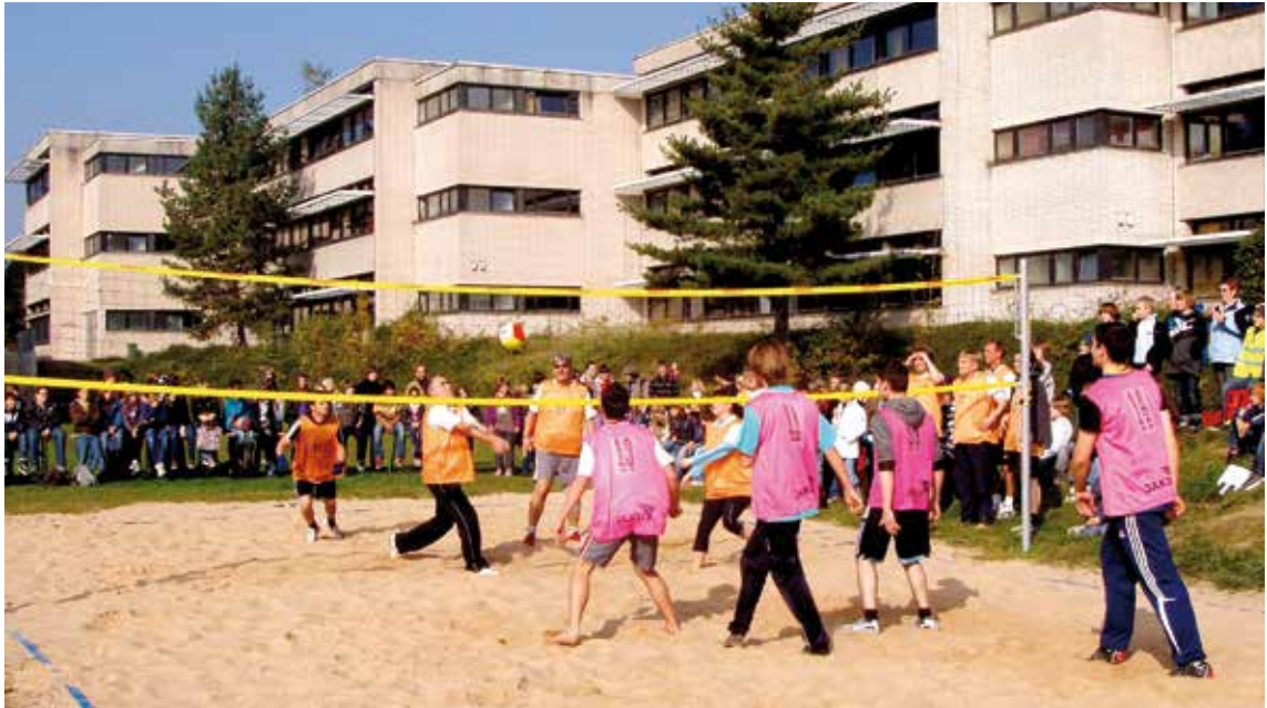
Schülerheime und Internate