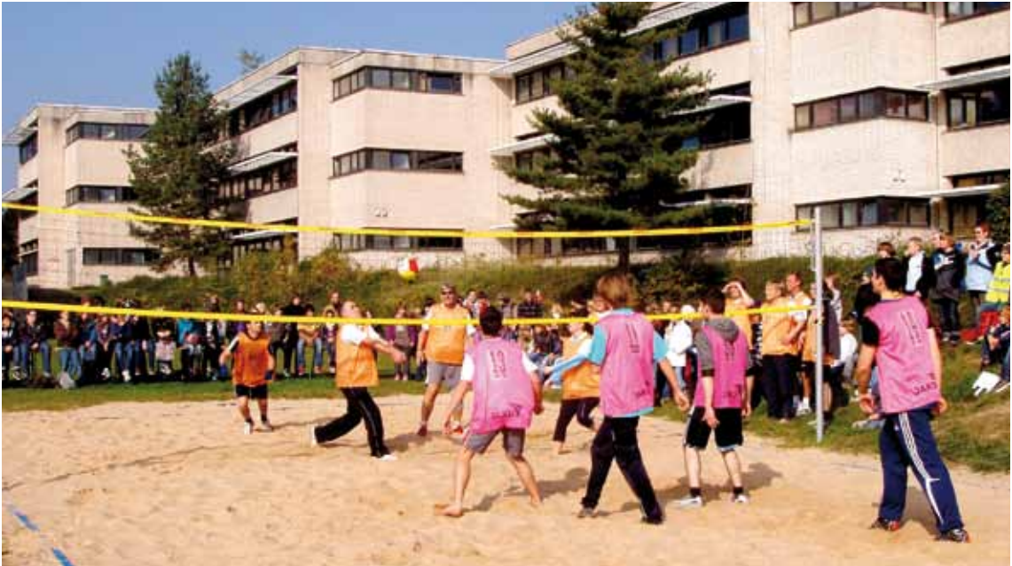
Schülerheime und Internate